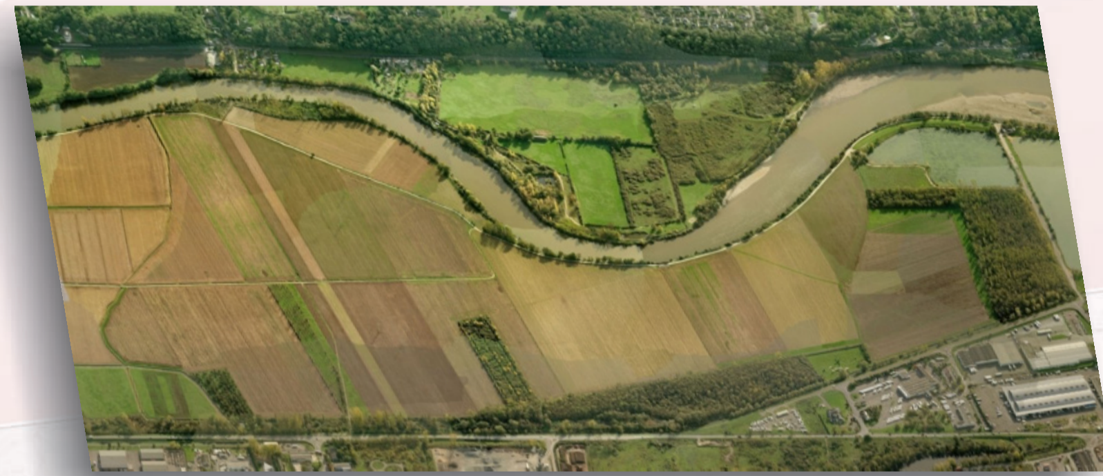
Vallée du Cher

- Doivent conserver leur vocation de champs d'expansion des crues