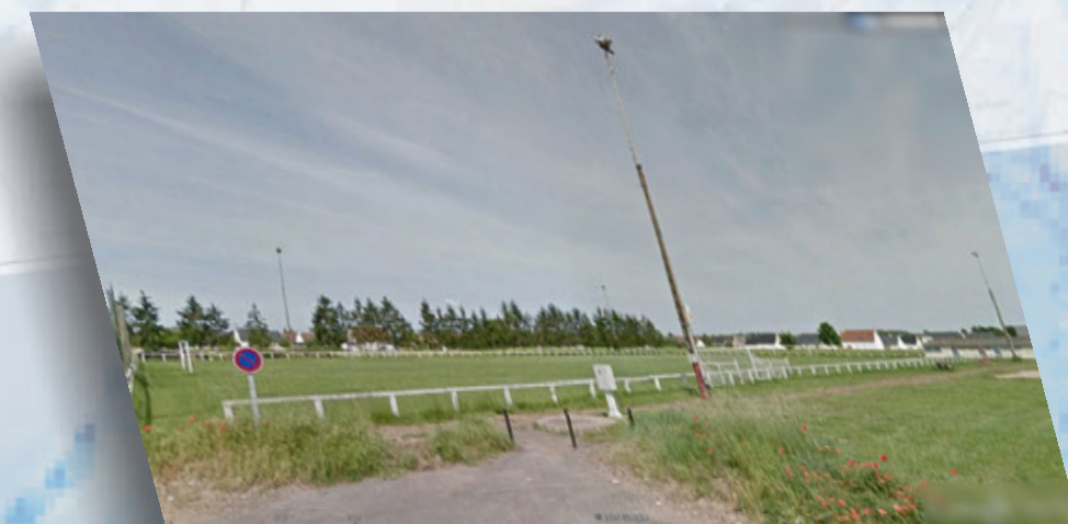
Terrain de sports municipal

- Peuvent permettre l'évolution des constructions existantes suivant le niveau d'aléa auxquelles elles sont exposées