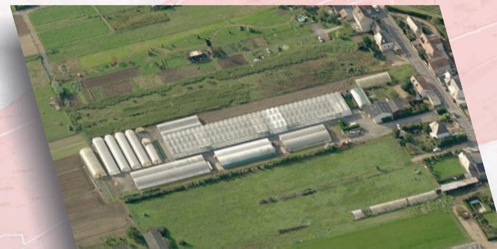
Zone maraîchère - Saint-Genouph